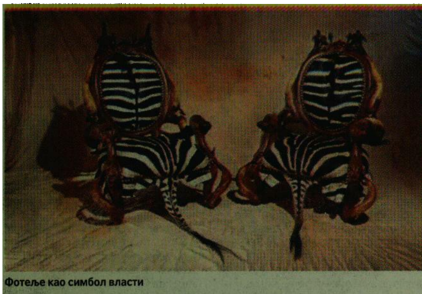
Фотеље као симбол власти