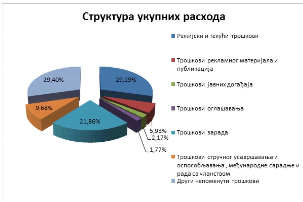
Графикон 2: Структура укупних расхода политичких субјеката по врстама у процентима

На основу претходних података може се видети да политички субјекти који највише приходују, највише и троше, с тим што се један део политичких субјеката понашао