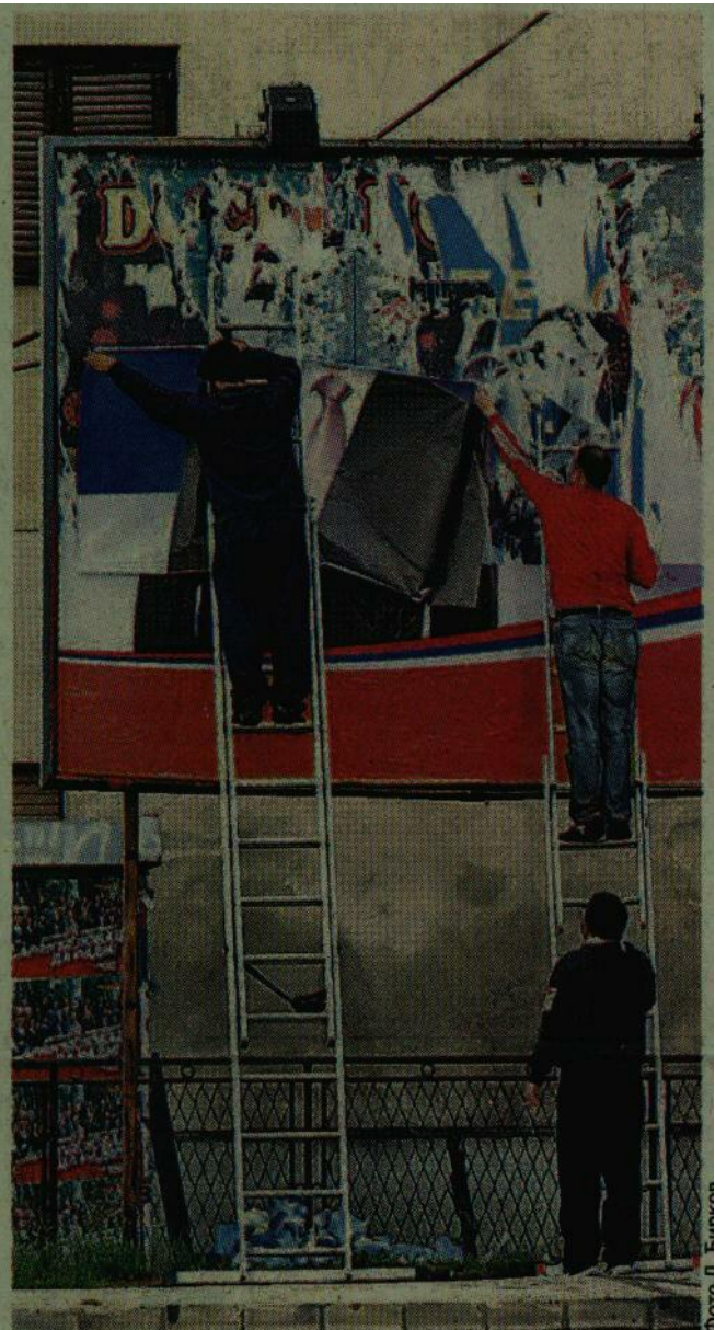
Трошкови оглашавања под лупом контролора

У извештају теренског посматрача, уз назнаку назива учесника избора, града и периода за који се извештај сачињава, наводиће се за коју врсту избора се подноси извештај, а потом се за сваки материјал – летке, брошуре, новине, плакате, билборде и други промотивни материјал као што су оловке и блокови, наводи број и врста изборног материјала, број дистрибуираних или објављених комада уз димензију плаката и билборда, са локацијом где се налазе, начин дистрибуције новина и број активиста који су дистрибуирали материјал у извештајном периоду.