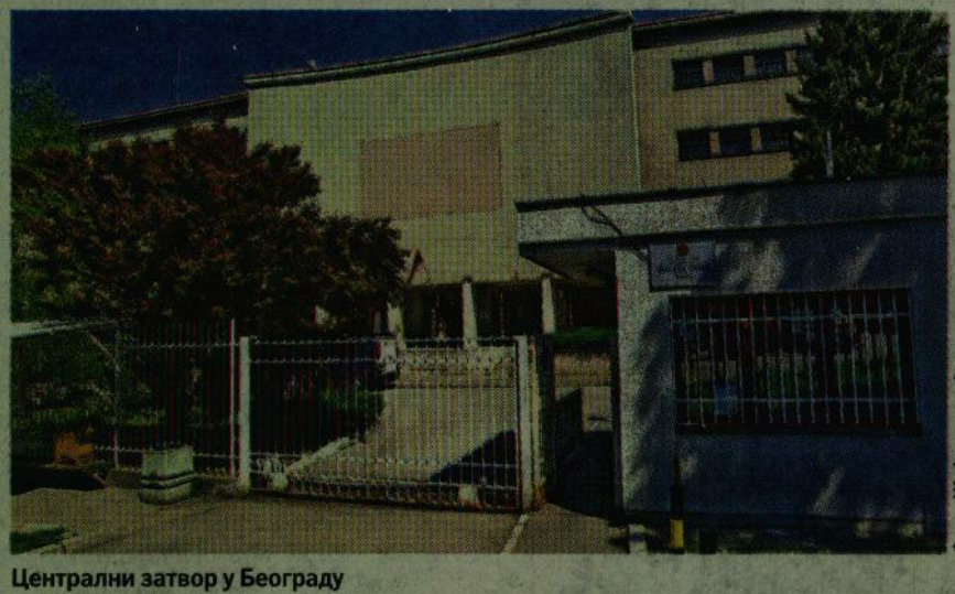
Централни затвор у Београду

Овде је, како је објаснила наша саговорница, у питању скраћени по-